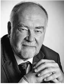
Gerhard Weißgrab Präsident der ÖBR